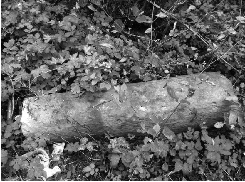
Єдина вціліла мацева з єврейського цвинтаря Кисилина, 2016 р. The only remaining matzevah from the Jewish cemetery in Kysylyn, 2016.